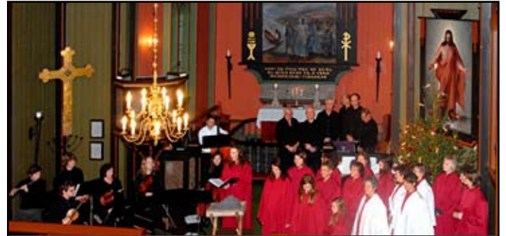
Bilete frå framføringa i 2010.

Neste scene er Betlehemsmarkene, der «Hyrdar stirrer i natten ut» med mørkt vemod attmed bålet, før alt skifter radikalt når «Lysen strålte, og engler sang så deilig et Ære være». Gjetarane (mannskor) tek stav i hand og vandrar så å seie fysisk til stallen, medan Dagsvik let damene langs vegen nynne mun-tert både «Å jul med din glede» og «Her kommer dine arme små». Rundt krybba syng damekoret