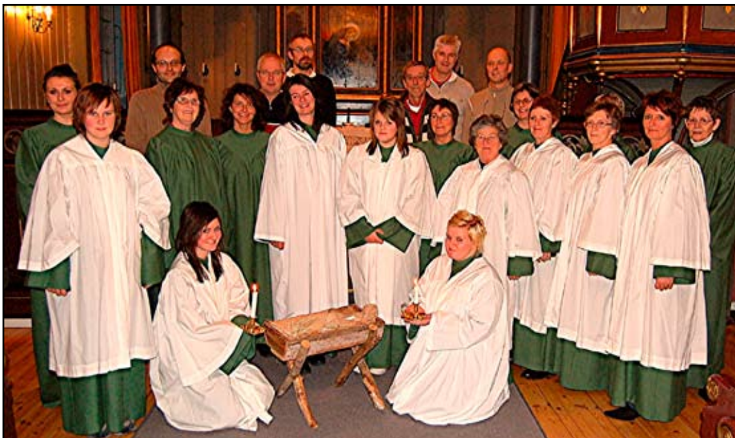
Bilete frå framføringa i 2008.