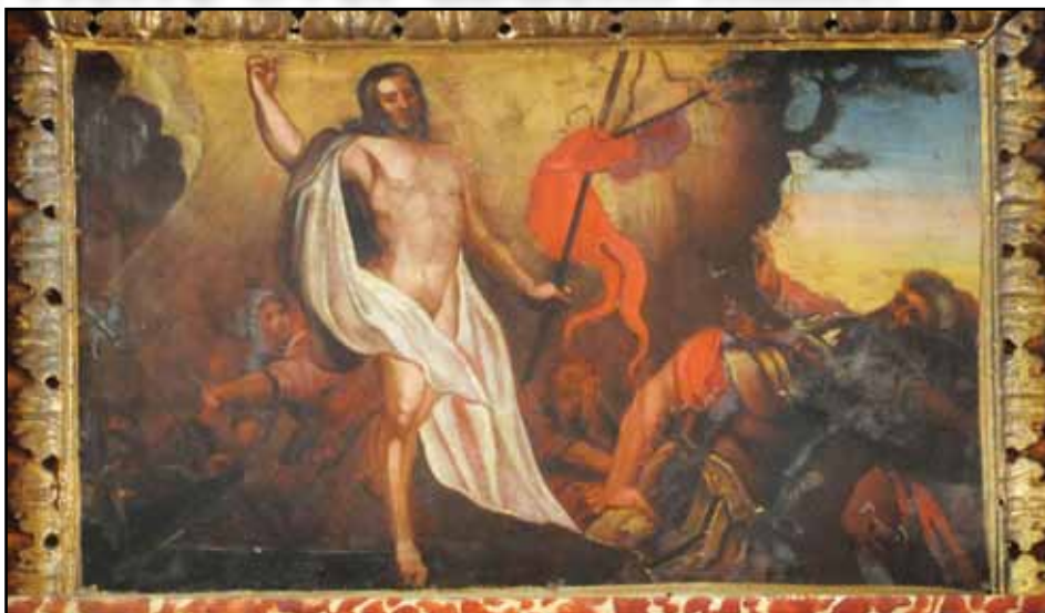
Oppstandelsen, fra altertavla i Halså kirke.

Ut ifra Evangeliet etter Markus, ble Jesus kropp tatt ned fra korset om kvelden samme dag. Det var forberedelsesdagen – det vil si dagen før sabbaten – og det var alt blitt kveld. Josef fra Arimatea, en høyt aktet rådsherre som selv ventet på Guds rike, tok da mot til seg og gikk til Pilatus og ba om å få Jesu kropp. Pilatus fant det underlig at han allerede skulle være