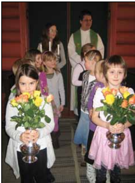
I dag hjelper fleire til med å plassere tinga på alteret.