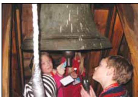
Ved klokka i tårnet

Vi nærmar oss påske. På ein eller annan måte har vi alle eit forhold til påska. Mange av 1. og 2.-klassingane har vore i kyrkja no før påske og vandra gjennom påskeforteljingane. Då blir det aktuelt og levande. For oss andre vil vandringa bli på ein annan måte. Heime eller på hytta kan påskedramaet få følgje oss. Det er godt å bruke bibel, andaktsbok og salmebok for å finne påska sine ord og bilde. Og i kyrkjene samlast vi til gudstenester som fører oss gjennom dei ulike påskedagane og får oss til å kjenne at påske – det gjeld liv og død – for Jesus og for oss som menneske og kyrkjelydar. Vel møtt i kyrkja i påska!