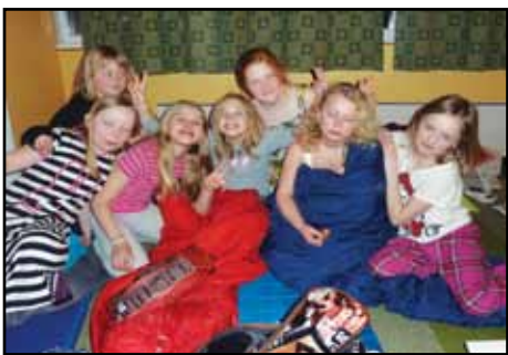
Før vi somnar