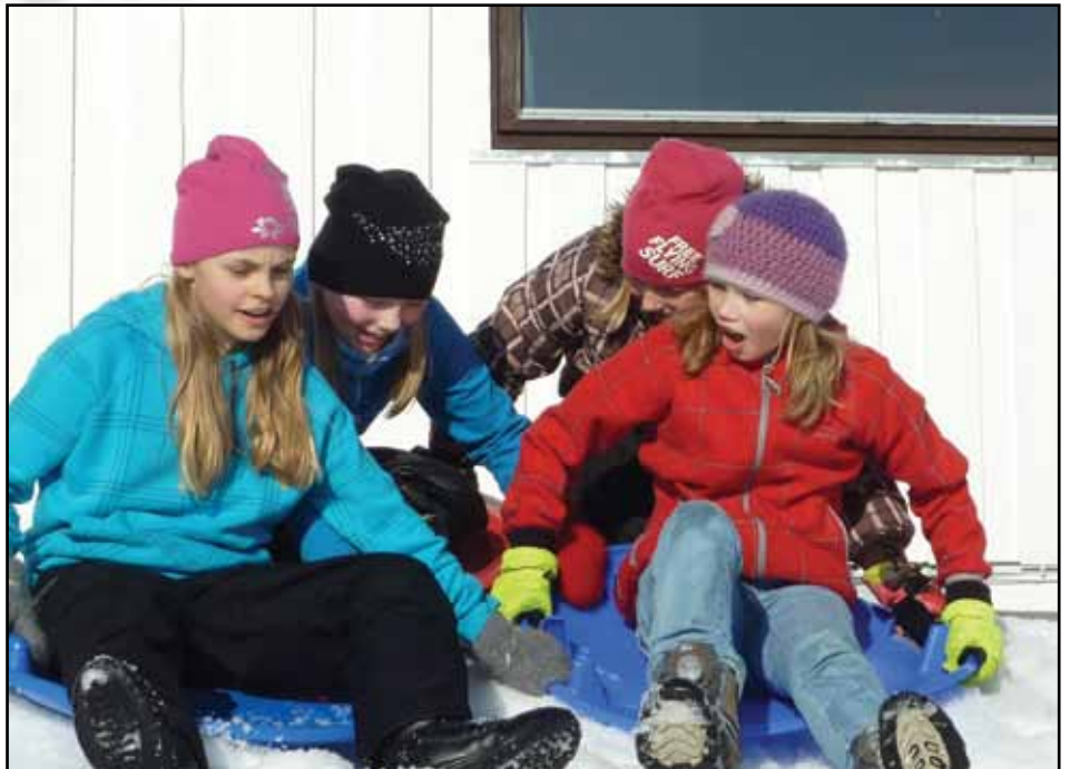
Klar på akebretta

Mange forventningsfulle tårnagentar vart kontrollert, sjekka inn og var i aksjon på tårnagenthelga i Øre kyrkje. (Bilde: Kontroll). Dei lærte av politiet korleis ein skal finne spor, og dei undersøkte heile kyrkja på jakt etter symbol. Svært mange symbol vart oppdaga, og nokre vart vist fram på gudstenesta søndagen. Elles var sjølvsaugt tårnet eit naturleg høgdepunkt for ein tårnagent, der klokker og lyd vart utforska. Det vart ei flott helg!