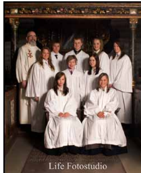
KONFIRMANTER I HALSÅ KIRKE 16.05.2010