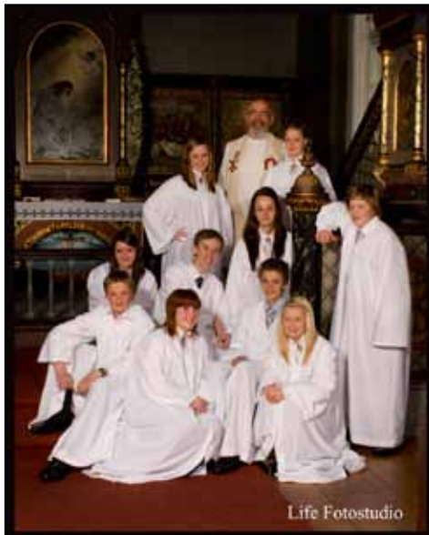
KONFIRMANTER I VALSØYFJORD KIRKE 09.05.2010