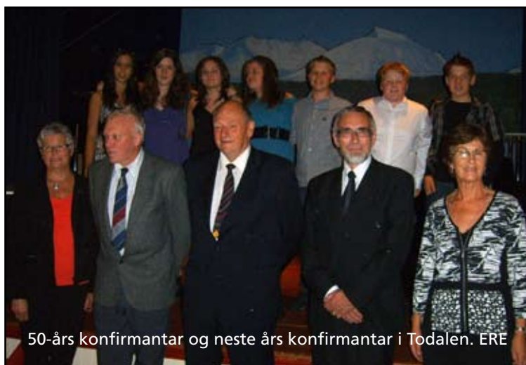
50-års konfirmanter og neste års konfirmanter i Todalen. ERE