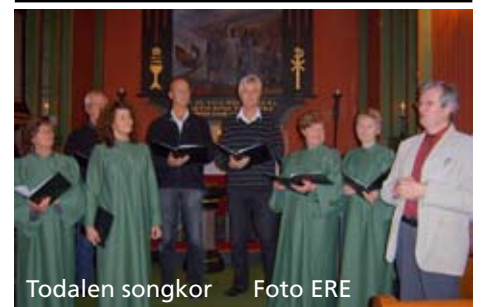
Todalen songkor