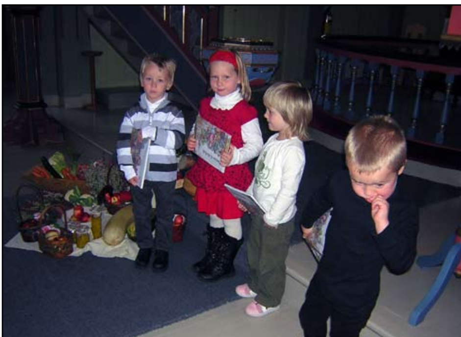
Dei 4 4-åringane som fekk bok i Gjemnes kyrkje under hausttakkefesten.

Dei fleste nordmenn tilhøyrer Den norske kyrkja, og mange uttrykker sitt religiøse liv gjennom kyrkjens ritual og høgtider. Kvart år blir det halde over 70.000 gudstenerer i 1600 kyrkjer i dei 1285 sokna, forutan ca 55.000 gravferder og vigslar. Over 3 % av folketallet går til gudsteneste kvar veke.