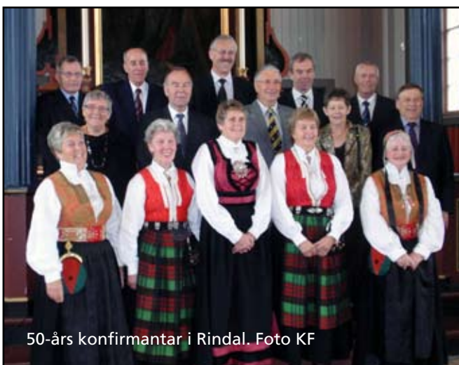
50-års konfirmanter i Rindal.

Presten kunne fortelja at det blir fleire konfirmanter i Todalen i 2010, med 8, enn det var for femti år sidan, i 1959 med 7.