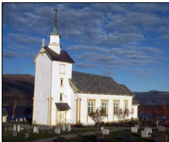
Valsøyfjord kirke.

Og de to skal være ett! Ikke et brudepar denne gangen, men Halså sokn og Valsøyfjord sokn. Jeg vil gratulere det nye storsoknet! Her ligger det mange og gode muligheter, ikke minst ved at det er ett menighetsråd som skal ta alle avgjørelsene om konfirmantarbeid, gudstjenestelister, kirkeoffer osv. Jeg veit at det blir lettere å være prest, men jeg er og sikker på at det blir bedre å være menighet.