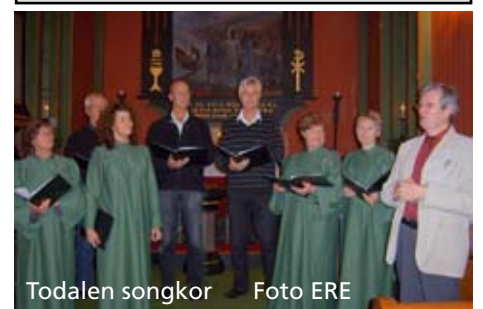
Todalen songkor