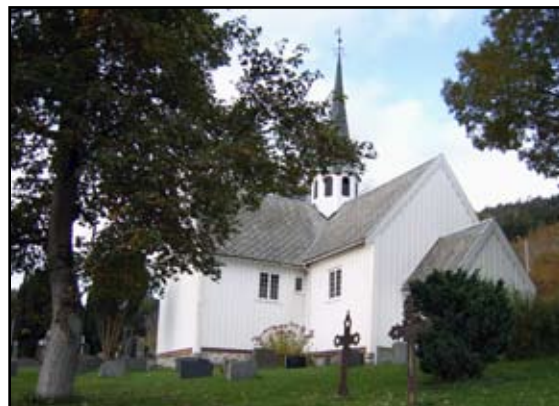
Halså kirke.