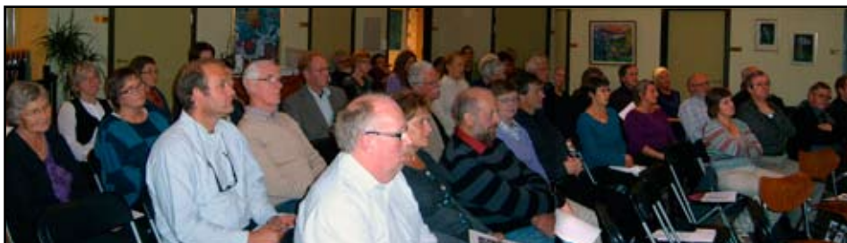
Sokneråda i prostiet samla til møte med biskopen og prosten