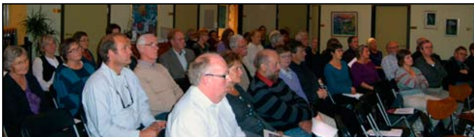
Sokneråda i prostiet samla til møte med biskopen og prosten