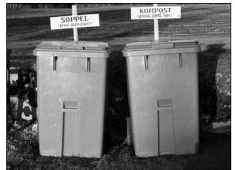
På mange av kirkegårdene er det kilde-sortering. Husk å kaste søppel i riktig kasse!