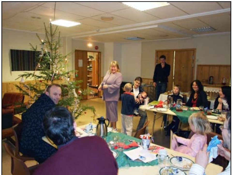
Det ble julegaver til alle barn under 56 år (!) på nyttårsfesten på Phillipshaugen.