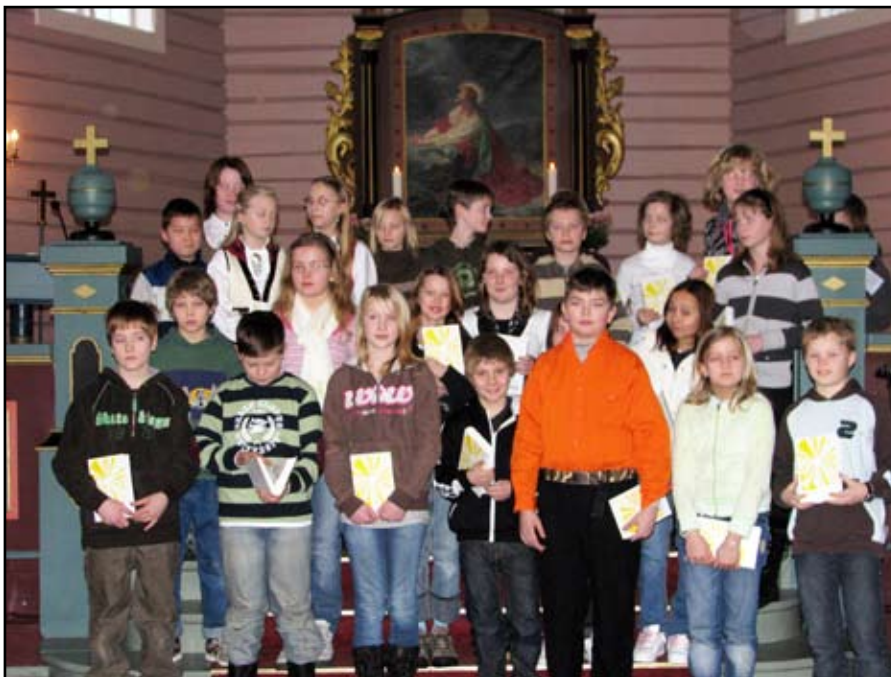
Her ser vi 5.-klassingane som fekk bibel i Øre kyrkje.

Bibelutdeling er første punkt i kyrkje-lydane sitt arbeid overfor denne aldersgruppa, vi kallar det 11-årsfasen. Snart reiser dei på eit døgn leir i Flemma, og til hausten kan dei starte på KRIK 11.