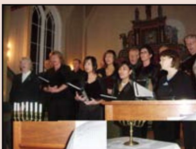
Øksendalskoret deltok på songkveld i Romfo.