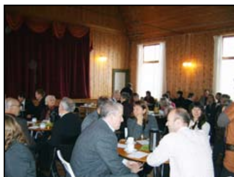
Kyrkjekaffen i Bondehuset samla også fullt hus til ei feststund med flotte kaker, fint program, helsingar og gåver.

I preika fortalde han dramatisk og levande om si lengste reise gjennom Sibir til misjonærteneste i Japan for 40 år sidan. Etter mykje uro og engsting var han lukkeleg over å sjå ein kjent person som møtte han på kaia i det framande landet. Ut frå dagens tekst frå Joh 17,1-8, der Jesus seier at det evige livet er å kjenna han, kobla han dette til vår livsreise der vi ikkje veit så mykje om korleis det er i det framande landet vi er på reise til. Men det betyr ikkje så mykje