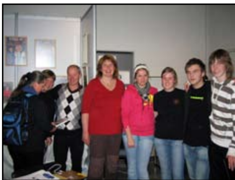
Her er gjengen som var i Oslo og presenterte trusopplæringsprosjektet. Kanskje treffer du dei att på leir til sommaren?