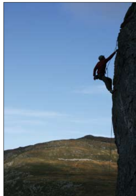
Klatring er ei av dei nye linjene på Høgtun i år.

Tiden er inne for å takke alle dem som har gjort dette mulig. Takken går til dere som har tro på det vi driver med, som støtter oss og har omsorg for oss. Denne støtten er