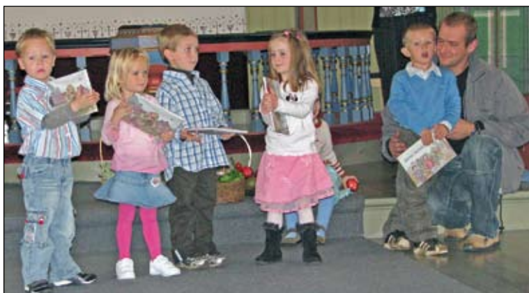
Sjå dei fine bøkene våre!