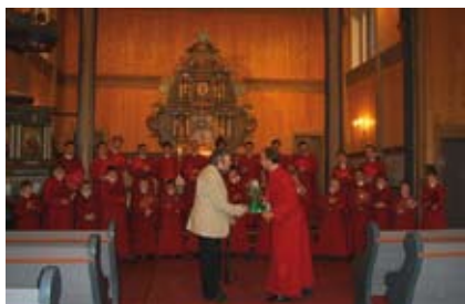
Petter Dass-kveld i Todalen kyrkje.

Eit av Englands flottaste gutekor, Gloucester Katedralkor, gjesta Stangvik-kyrkja 21. september i samband med Kristiansund Kirke Kunst Kultur-Festival (KKKK). Dei imponerte stort og hadde ingen problemer med å fylle Stangvik-kyrkja med vakker kyrkjemusikk.