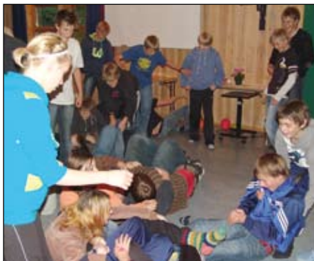
Her gjelder det statskirkens samhold mot ytre krefter.

I tidsrommet 7. til 9. september var 52 konfirmanter fra Halså og Surnadal på konfirmantleir på Mjuklia. Vi hadde også med oss 12 ledere. Tiden på leiren ble fylt av forskjellig aktiviteter. Noen red, andre drev med bueskyting, pistolskyting eller kanopadling. Ellers var vi der for å bli kjent med hverandre og å lære å være i lag. På søndagen hadde vi en ungdomsgudstjeneste med nattverd. Det var en flott gruppe med konfirmanter vi hadde med oss. Vi lekte mye og hadde også alvorligere kveldssamlinger med andakt og bønn. Akkurat slik vi håper konfirmanttiden kan være med både skjemt og alvor. Jeg kan ikke svare for konfirman-