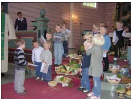
Vi har fått bok.