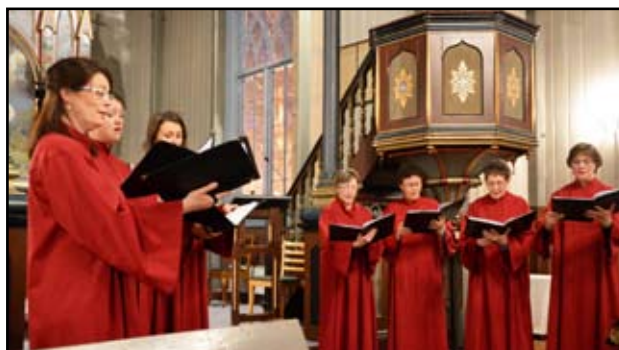
For 33. år på rad inviterer Åsskard Kyrkjekor til «Jonsvaka».

Sidan 1982 har Åsskard Kyrkjekor invitert til kyrkjeleg kulturfest ved St. Hans-tider – i pakt med tradisjonen frå mellomalderen. Den 33. «Jonsvaka» i rekkja blir feira om kvelden på sjølve jonsokdagen - tysdag 24. juni i den vakre Åsskard-kyrkja.