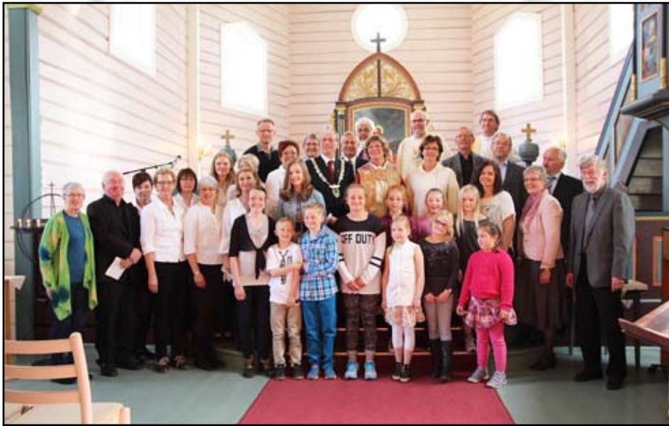
Alle medverkande under visitasgudstenesta – stor involvering!

Bispevisitas – til glede, inspirasjon og utfordring – slik opplevde dei fleste av oss visitasen i Gjemnes og Øre. Det omfattande programmet førte til gode møte med barnehage, skuleelevar og lærarar, speidarar,